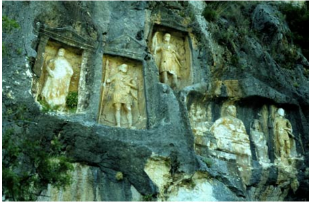
Abb. 2: Felsreliefs bei Adamkayalar

Wir wollen uns ein Bild vor Ort machen und nicht nur Tarsos, sondern Kilikien als ganzes kennenlernen. Dabei bewegen wir uns zeitlich (März/April!) und v.a. räumlich weit ab von den ausgetretenen Tourismuspfeilen. Umso reizvoller werden die landschaftlichen und antiken Eindrücke sein.