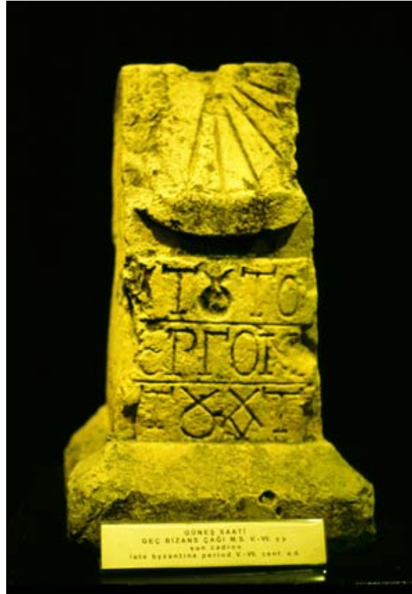
Abb. 4: Byzantinische Sonnenuhr mit Inschrift

bevölkert, kein attraktives Ziel für einen normalen Menschen, geschweige denn für einen römischen Senator. Dies wird exemplarisch deutlich an der Korrespondenz des Marcus Tullius Cicero, der 51/50 v. Chr. Statthalter der Provinz Cilicia gewesen ist.