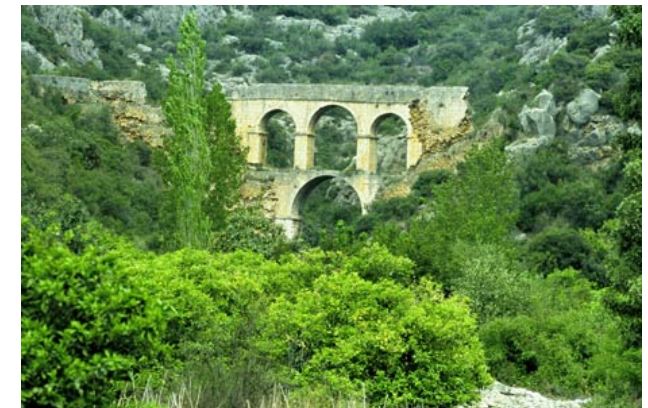
Abb. 1: Aquädukt bei Elaioussa Sebaste

„Ich bin ein jüdischer Mensch, ein Tarser aus Kilikien, Bürger einer nicht unbedeutenden Stadt“, sagt Paulus nach Apg 21,39. Was bedeutet es für Paulus, Bürger der kilikischen Metropole Tarsos zu sein?