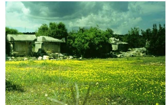
Abb. 5: Korykos: Nekropole mit Blumen

Zur Vorbereitung dieser Exkursion wird eine zweistündige Übung (Mittwoch, 8.30 Uhr bis 10.00 Uhr im Hörsaal A des Theologischen Seminargebäudes) durchgeführt. Die Teilnahme an der Übung ist Voraussetzung für die Teilnahme an der Exkursion.