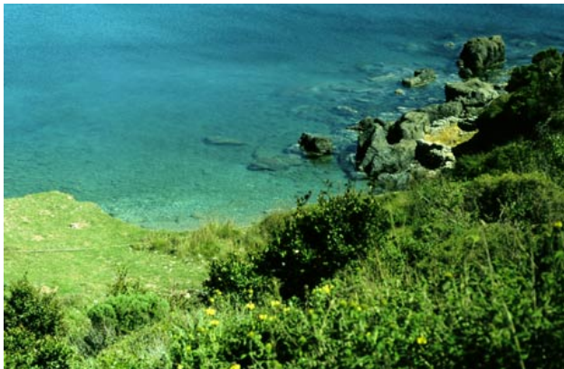
Abb. 3: Anemurion: Die südlichste Spitze der Türkei Kilikien galt in der Antike als ziemlich hinterwäldlerisch, ohne Kultur, dafür mit vielen Piraten