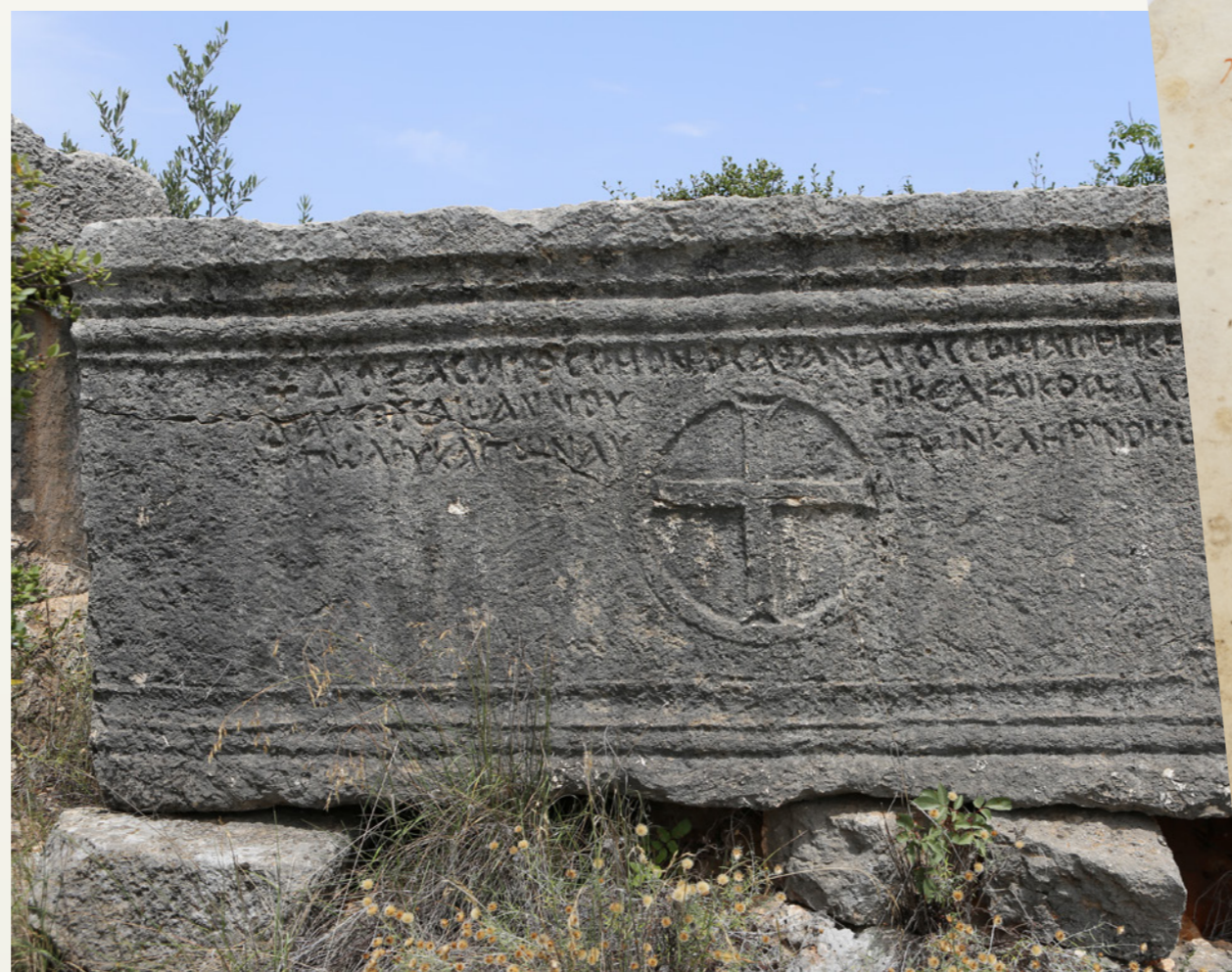
Die Inschrift MAMA III, Nr. 494 auf einem Sarkophag in der Nekropole von Korykos.

Allein aus dem Hafenort Korykos stammen fast 700 überwiegend christliche Inschriften, aus denen sich ein vielseitiges Bild des Lebens der Christen in diesem Ort gewinnen lässt: Von der lokalen Heiligenverehrung (etwa der Heiligen Charitine) über die zivilen Berufe und sozialen Tätigkeiten bis hin zu den Ämtern in der Gemeinde. Knapp 20 jüdische Inschriften werfen zudem ein Schlaglicht auf den Alltag in der Diaspora.