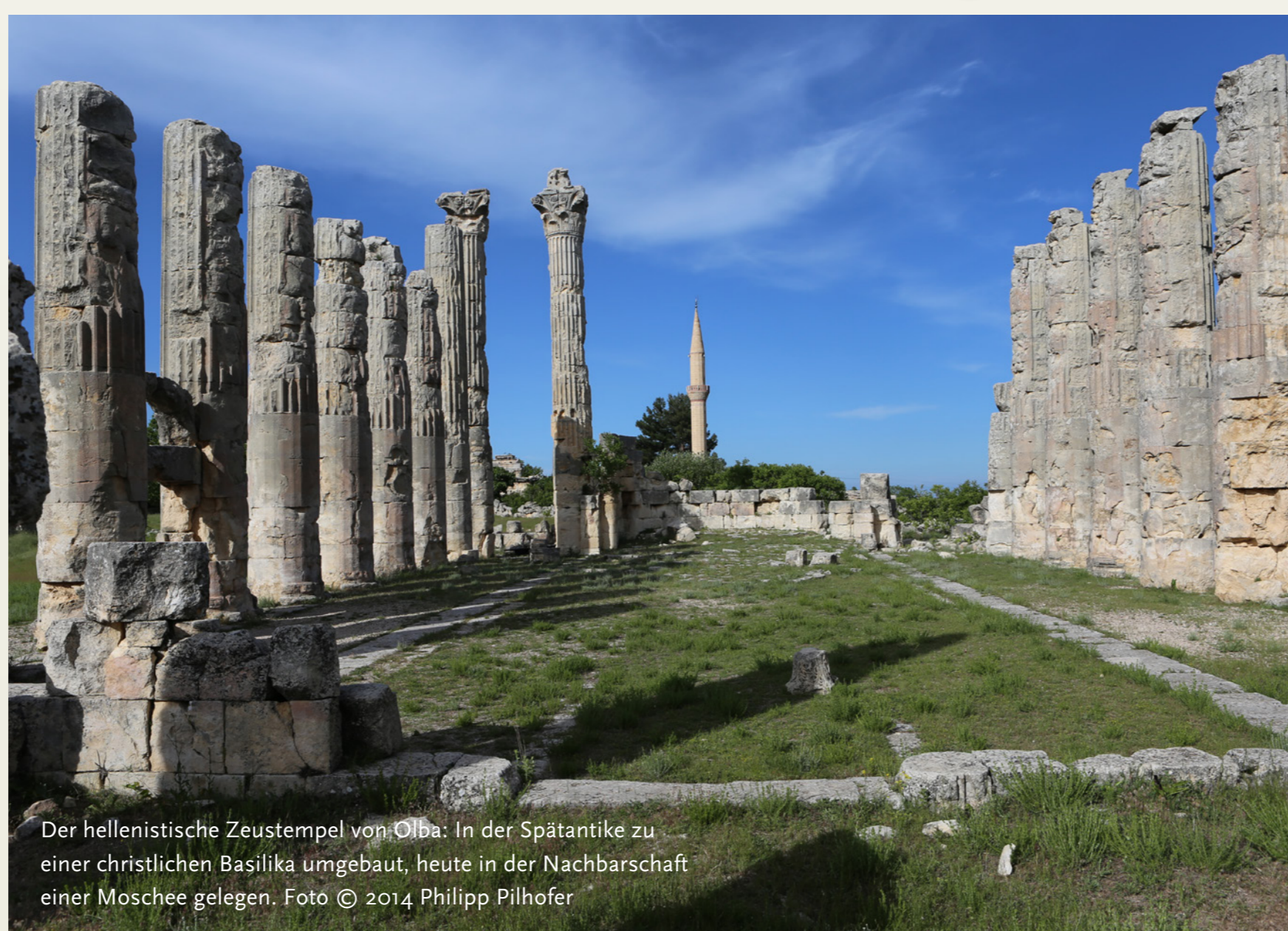
Der hellenistische Zeustempel von Olba: In der Spätantike zu einer christlichen Basilika umgebaut, heute in der Nachbarschaft einer Moschee gelegen.

Insgesamt sind weit über zweihundert spätantike Kirchengebäude nachweisbar, selbst auf den entlegensten Bergkuppen finden sich solche Ruinen. Der große Pilgerkomplex der Heiligen Thekla bei Seleukeia am Kalykadnos nahm die Ausmaße einer Stadt an, mit Badehaus, großen Zisternen und sogar einem Aquädukt. Aber auch in kleinen Ortschaften wurden viele Kirchen gebaut, so daß in einigen Orten die lokale Bevölkerung nicht ausgereicht haben kann, diese zu füllen. Neben den Gebäuden lassen sich eine Reihe von Kleinfunden, wie beispielsweise Pilgerampullen oder Reliquiare, heranziehen.