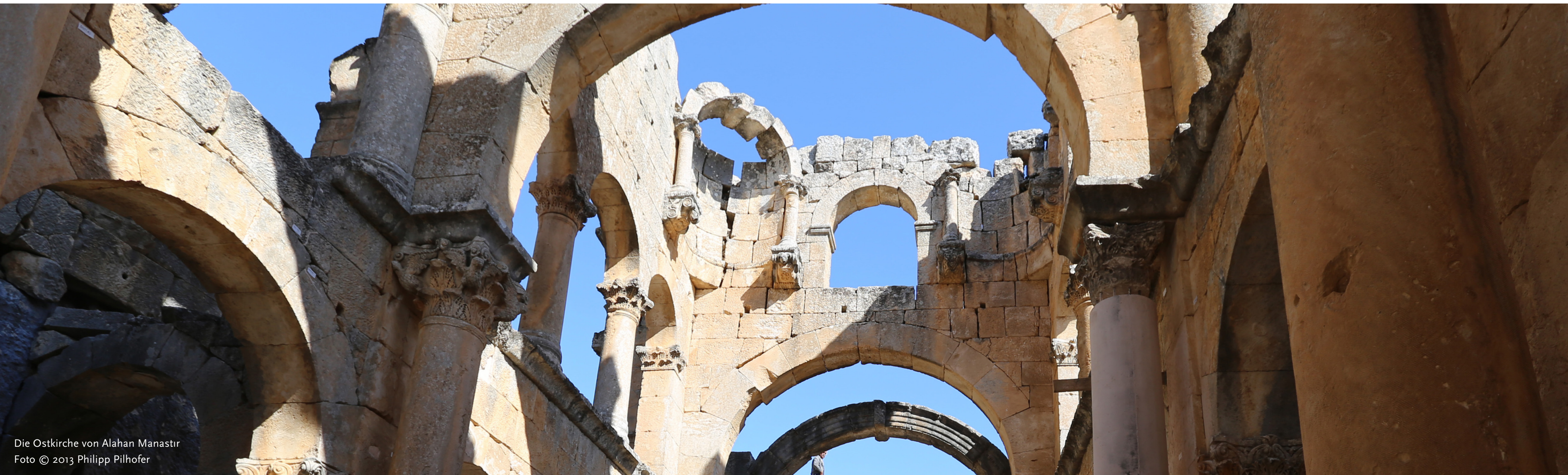
Die Ostkirche von Alahan Manastir